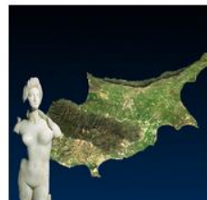
Cyprus Tourist Guide NetRL, University of Cyprus