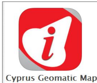
Cyprus Geomatic Map