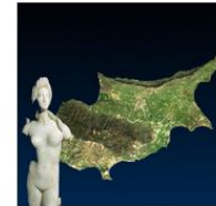
Cyprus Tourist Guide NetRL, University of Cyprus