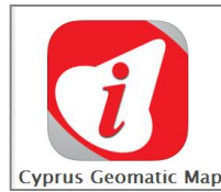
Cyprus Geomatic Map